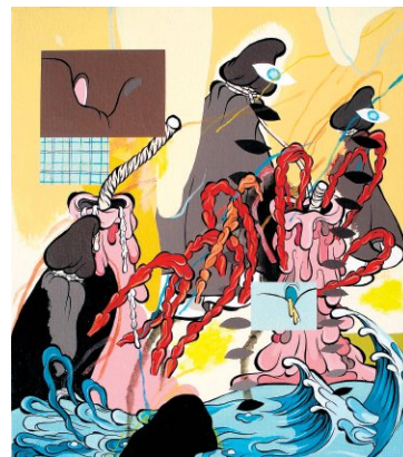
Werk van Mulrone bij MAMA

nis maakte een grote kleurrijke pop die blijkt te zijn opgebouwd uit lichamen van rode, blauwe en gele naakte moslimmannen. Een heel grafisch werk is van Koen Talselaar die in 2008 afstudeerde aan de Willem de Kooning Academie. Je ziet een grote afbeelding die bestaat uit losse onderdelen die weer heel grafisch met krullen, cirkels en geometrische patronen zijn ingevuld. Rode draad is dat al het werk is opgebouwd uit kleinere fragmenten.