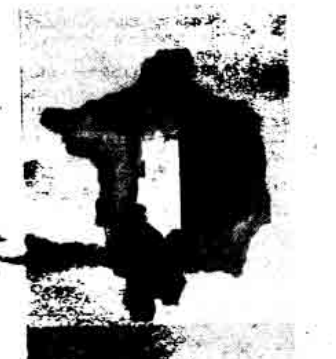
'what is Rubbley', 1956

herman de vries vertegenwoordigt volgend jaar Nederland op de 56ste editie van de Biënnale voor hedendaagse kunst in Venetië. De kunstenaar zal in het Nederlandse paviljoen nieuw werk presenteren. De materialen daarvoor wil hij verzamelen op verlaten eilanden in de Venetiaanse lagune die zijn overwoekerd door de natuur. Het Mondriaan Fonds koos de vries uit vijf kandidaten. Een verrassende keuze, maar de jury meent dat de presentatie van de vries een 'krachtig, intiem, sober en actueel geluid zal zijn binnen het spektakel van de biënnale'.