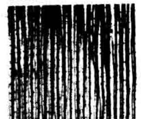
'rosa canina' 2001