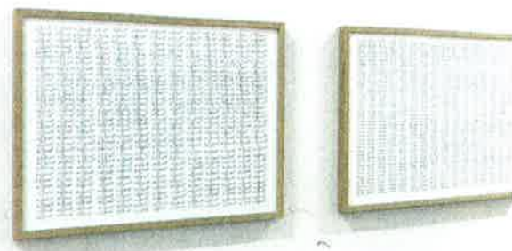
herman de vries, Different en Identic

De vries presenteert de werkelijkheid als kunst, zo direct mogelijk. Vanaf 1975 in feite de werkelijkheid van de natuur met haar cycli van groei en vergankelijkheid. Series gedroogde bladeren van één en dezelfde boom, bijna identiek maar vooral juist gevarieerd, zoals als de schelpjes van eenzelfde soort. Door middel van herhaling en eenvoud, precisie en terughoudendheid weet hij je aandacht te vragen voor verschijnselen waar we maar al te vaak aan voorbiplopen... of overheen. Het werk 16dm² (1975) treft me bijzonder, een stukje weiland van 40 bij 40 cm is door de vries minutieus ontleend en blijkt maar liefst 473 plantjes te bevatten. Elk plantje is gedroogd en apart in een pretentieloos plastic ringbandmapje gedaan; een lange wand vol! In dezelfde zaal ligt een half vergaard stronk in een vitrine. De vries licht toe hoe hij er al een paar jaar