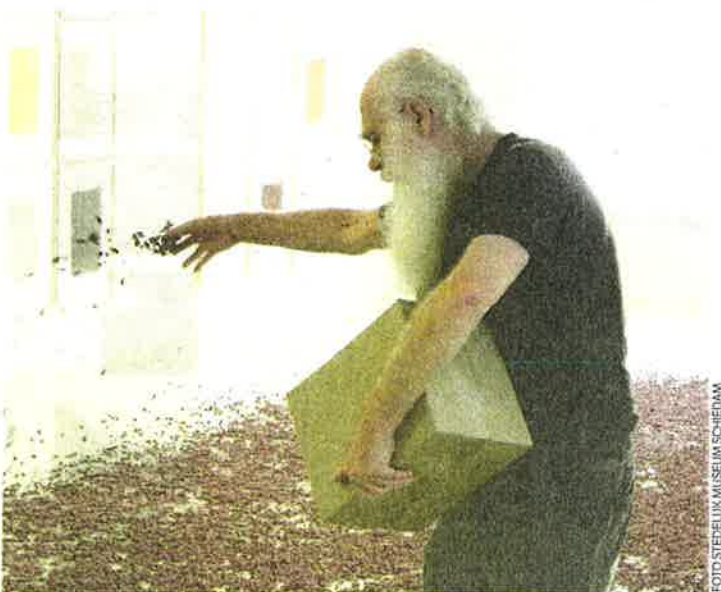
herman de vries aan het werk in Museum Schiedam.

Hij is niet de enige tachtiger die opeens weer middenin de belangstelling staat. Kijk naar Armando (85), die dit jaar een eigen museum kreeg in Oud-Amelisweerd en nu een solo heeft in het Kröller-Müller Museum. Net als herman de vries wordt hij bovendien in het New Yorkse Guggenheim Museum op de grote Zero-tentoonstelling geëerd als een van de oprichters van de Nulbeweging.