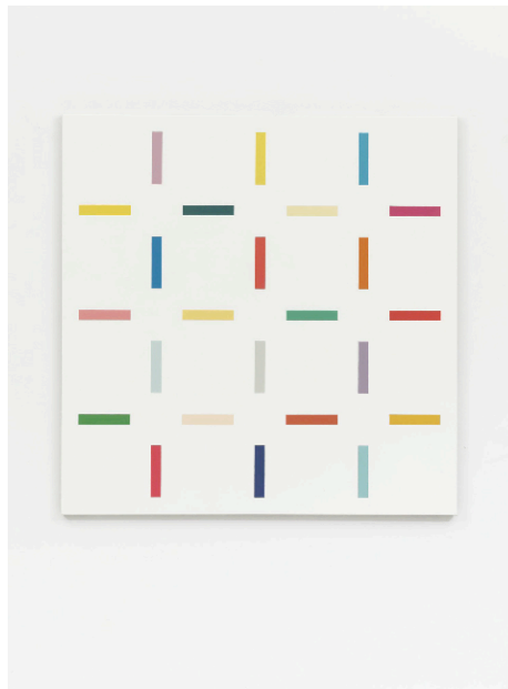
Steven Aalders, Celestial Chart (White), 2009, olieverf op linnen, 110 x 110 cm.

De opening vindt plaats op 12 februari van 15.00 tot 18.00 uur.