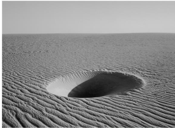
Deserts and skies #59, Paul den Hollander

Paul den Hollander doet door middel van fotografie onderzoek naar begrippen als ruimte, tijd en tijdloosheid en naar zijn eigen relatie met zijn omgeving. Het oeuvre van Paul den Hollander is een voorbeeld van fotografie die de grenzen van de vertrouwde waarneming doorbreekt en het onzichtbare zichtbaar maakt. In zijn foto's figureert een werkelijkheid die de toeschouwer wel herkent, maar die hij zelf nooit zo gezien zal hebben.