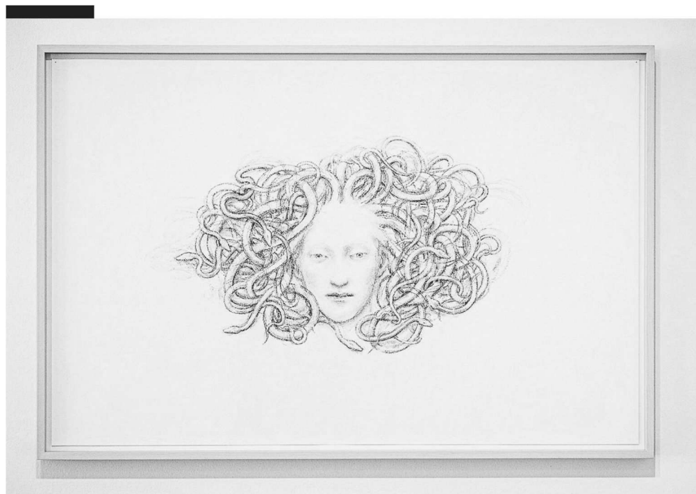
Juul Kraijer, Untitled (2020) in De Ketelfactory in Schiedam.